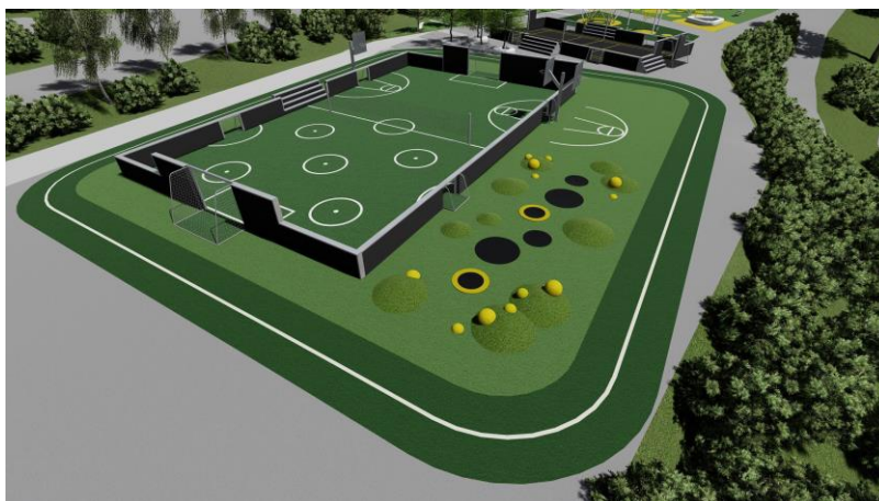
Figur 5: En ballbinge som muliggjør at flere personer kan holde på med ulike typer aktiviteter samtidig. Her er det mulig å koble til lydanlegg slik at man kan spille av musikk direkte fra telefon.

Den fysiske utformingen av uteområdet vil være viktig for å best mulig legge til rette for pedagogiske verktøy. Dette innebærer praktisk plassering av sitteplasser, amfi, tall og bokstaver, lydanlegg ute og anlegg som muliggjør allsidig aktivitet (se tegninger). Vi ønsker også å inkludere innovative elektroniske verktøy på uteområdet. Dette vil kunne gjøre undervisning utendørs mer attraktivt for både lærere og elever, og samtidig kunne invitere til fysisk aktivitet og læring for alle aldre. Eksempler på dette er «Playalive» fra leverandøren Uniqa som kombinerer den virtuelle verden, lek og læring. Følgende vil kunne være aktuelt å inkludere: