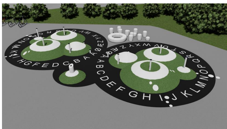
Figur 6: Språklek, Playalive.

Det vil jobbes aktivt med en strategi for implementering. I detaljreguleringen vil lærerne i de ulike fagene involveres for å sikre at elementene og apparatene faktisk vil bli brukt i undervisningen. For å styrke dette ytterligere vil enkelte lærere delta på en fysakkonferansen denne høsten (se referanseliste). Det vil videre legges til rette for at lærerne blir satt godt inn i databaser slik som ASK-basen (se referanseliste), for å få inspirasjon til hvordan undervisning