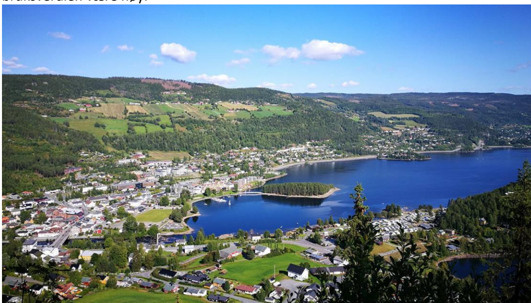
Figur 1: Fagernes

Nord-Aurdal ungdomsskole (NAUS) ligger i Fagernes sentrum, og er en del av «Tveit oppvekstområde», som også omfatter Nord-Aurdal barneskole (NABS), Valdreshallen, Fagernes barnehage og Frisklivssentralen. Alle institusjonene ligger langs samme akse, i gangavstand til hverandre, og uten særlig trafikkerte veier, noe som muliggjør det å knytte uteområdet ved NAUS opp mot en langsiktig og helhetlig plan. Tveit oppvekstområde ligger også i gangavstand til Fagernes idrettspark (Blåbærmyra), samt et friluftsparkområde ved Strandefjorden, og det kan på sikt være aktuelt å knytte dette sammen. Uteområdet ved NAUS vil kunne brukes daglig av rundt 700 barn, som er tilknyttet barnehagen og skolene, i tillegg til befolkningen som helhet. Anlegget vil være allment lett tilgjengelig; nært både institusjoner og befolkningsentra, samt muligheter for kollektivtransport. På den måten vil tilgjengeligheten og bruksverdien være høy.