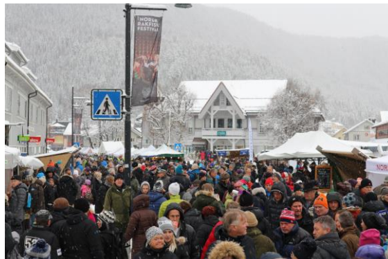
Figur 4: Norsk rakfiskfestival, Fagernes sentrum