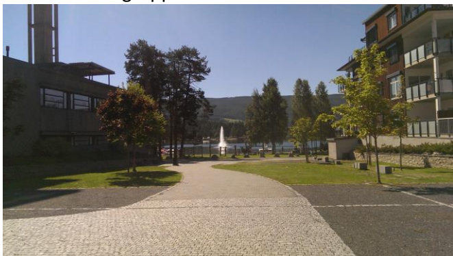
Figur 2: Gangakse Fagernes sentrum – parkområde

Hilme-stemnet og Rakfiskfestivalen, og blir kalt en festivalby. Nord-Aurdal kommune ligger også på topp i detaljhandel per innbygger, i både Oppland og landet generelt. Dette skyldes et høyt antall hytter i regionen, samt stor turistgjennomstrømning gjennom hele året. Tilreisende vil med dette også være en aktuell brukergruppe av en slik aktivitetsarena.