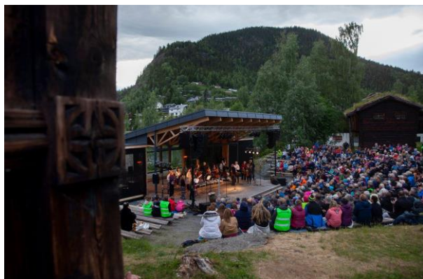
Figur 3: Valdres sommersymfoni, Valdres Folkemuseum, Fagernes