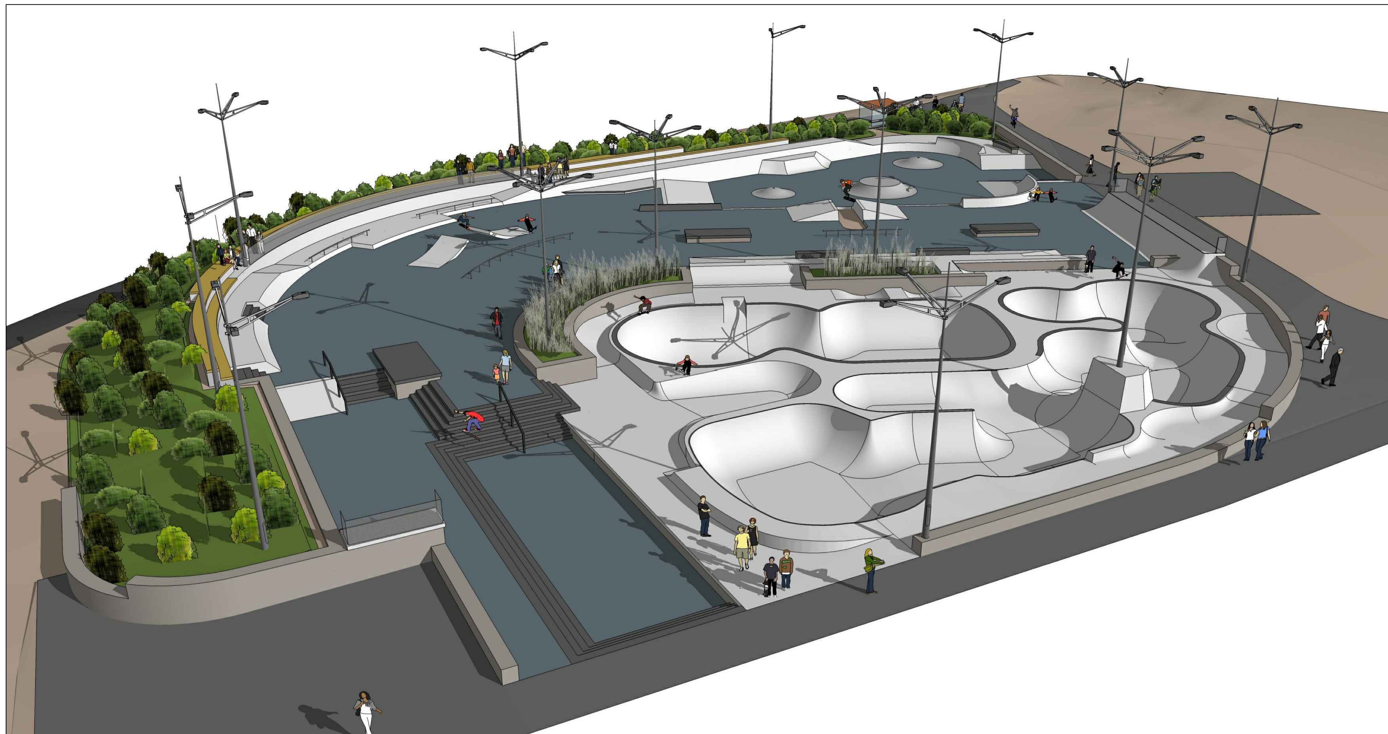
VY 7- FRA NORDVEST