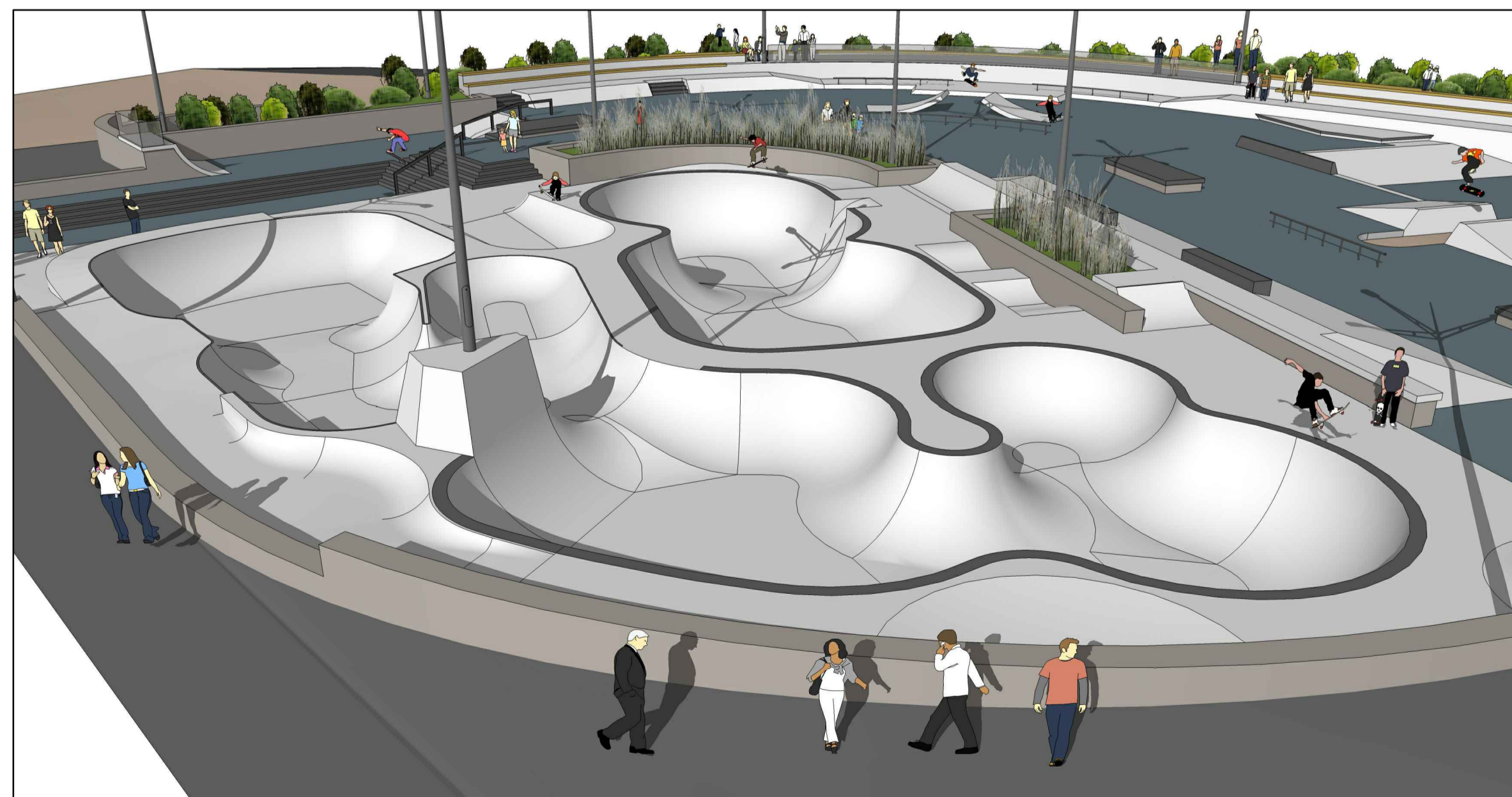
VY 8- FRA SØR